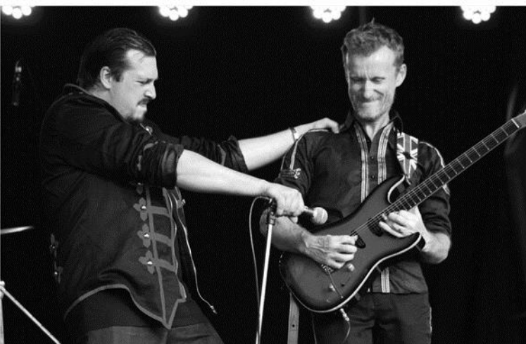
« LE » Grand moment du week-end ! Kind of Queen Tribute entre en scène pour un show exceptionnel. Pas facile de chanter du Freddie Mercury... et pourtant ! Un chanteur à la voix juste et puissante a fait basculer le public venu en très grand nombre ! Après Johnny Rock en 2018, un magnifique moment musical s'est joué sur la scène de la St Jean.