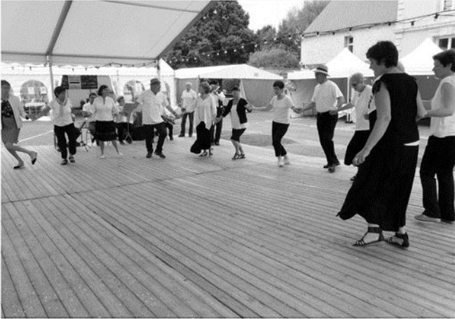
Dès 11h, les musiciens et danseurs de l'association Bacchanale accueillent les convives pour le vin d'honneur organisé par la municipalité.