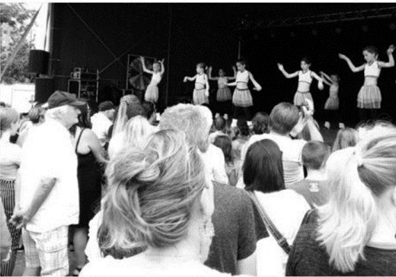
En début de journée, l'ADGS a présenté son spectacle de fin d'année aux nombreux spectateurs et parents présents pour l'occasion.