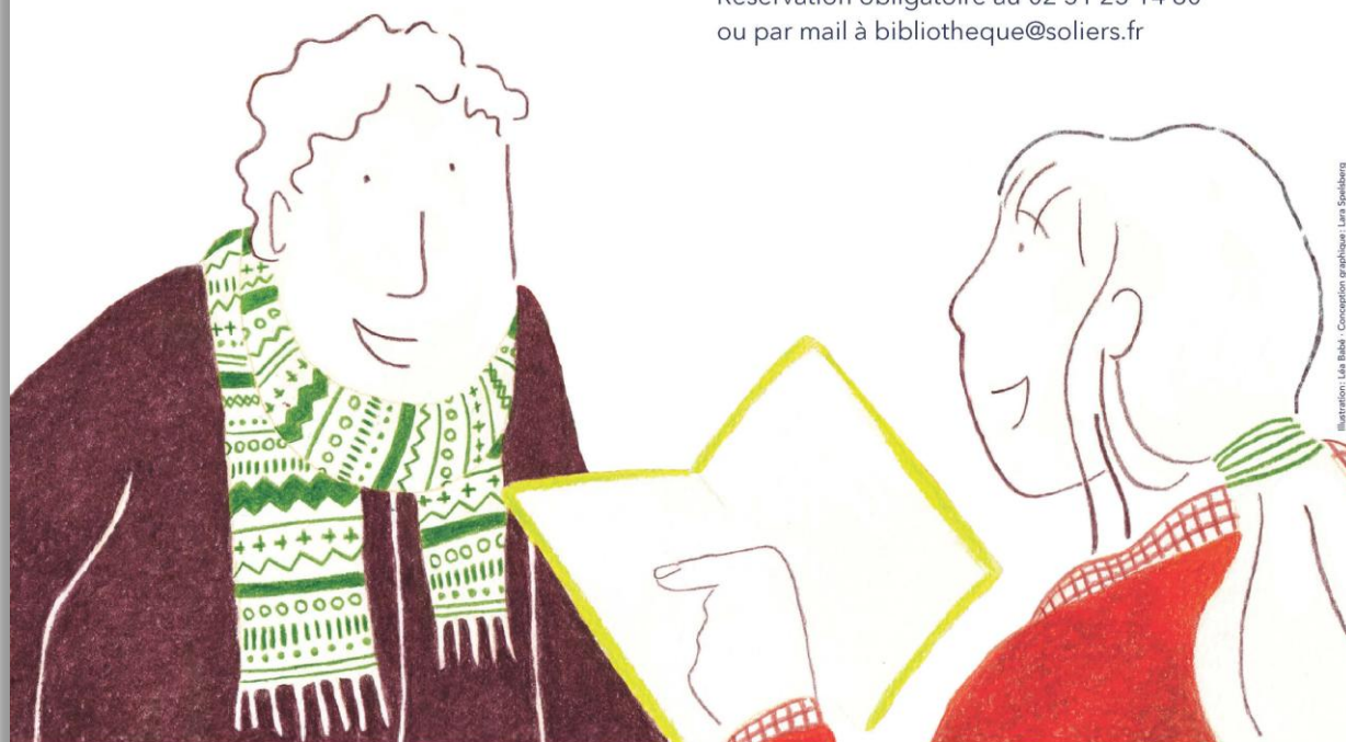
Illustration: Lila Babel - Conception graphique: Lila Spelsberg

Réservation obligatoire au 02 31 23 14 80 ou par mail à bibliotheque@soliers.fr